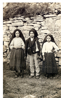
The Three Little Children of the Famous Fatima Apparitions.