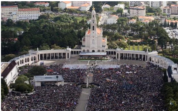
Pèlerinage à Fatima, au Portugal.

Les apparitions de Marie à Fatima (ou Notre Dame de Fatima ) sont très importantes au sein du Catholicisme. Selon l'Église catholique, Notre Dame de Fatima est apparue plusieurs fois à Fatima, au Portugal, de mai à octobre 1917, à trois petits enfants gardiens de troupeaux : Lucia, Francisco et Jacinta. L'Église catholique romaine a approuvé et pleinement accepté ces visions comme provenant de Dieu et ces dernières ont à leur tour atteint des centaines de millions de gens au fil du temps.