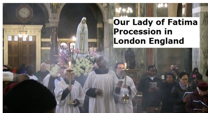
Procession de Notre Dame de Fatima à Londres, en Angleterre

Et ensuite, avec une triste expression, Elle a dit : Priez, priez beaucoup et faites des sacrifices pour les pécheurs, car plusieurs âmes vont en enfer parce qu'elles n'ont personne pour prier et faire des sacrifices pour elles. (p. 35) Je veux que vous sachiez que je souhaite qu'une chapelle soit érigée en mon honneur, parce que je suis la Dame du Rosaire. Continuez à dire le Rosaire chaque jour. (p. 40)