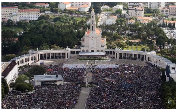
Pèlerinage à Fatima, au Portugal.

Les apparitions de Marie à Fatima (ou Notre Dame de Fatima ) sont très importantes au sein du Catholicisme. Selon l'Église catholique, Notre Dame de Fatima est apparue plusieurs fois à Fatima, au Portugal, de mai à octobre 1917, à trois petits enfants gardiens de troupeaux : Lucia, Francisco et Jacinta. L'Église catholique romaine a approuvé et pleinement accepté ces visions comme provenant de Dieu et ces dernières ont à leur tour atteint des centaines de millions de gens au fil du temps.